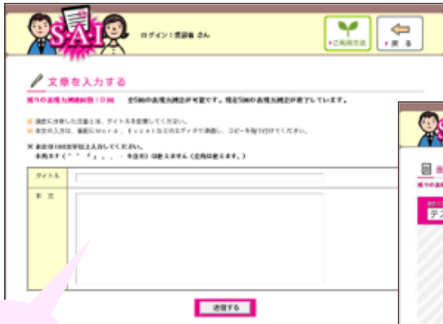
図書館利用者、受診者画面イメージ