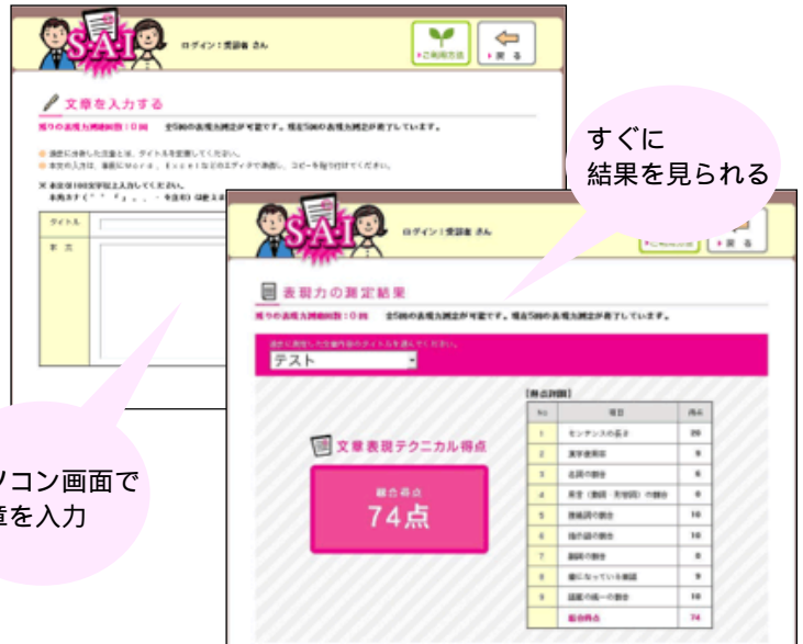
学生用、受診者画面イメージ