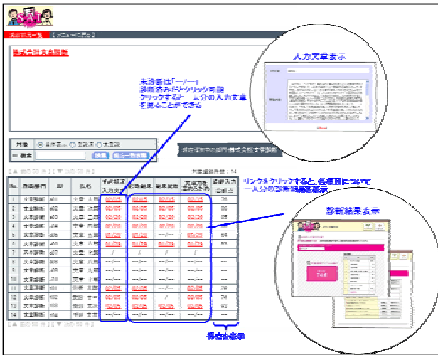
教員の皆様用、管理者画面イメージ